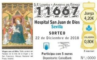
LOTERIA DE NAVIDAD