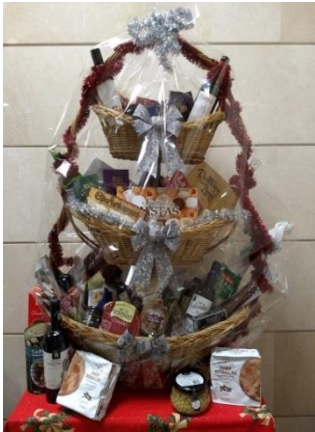
CESTA DE NAVIDAD

La madrileña Fundación Isabel del Lamo PATTO'S Por Una Infancia Digna nos hace entrega de productos de higiene y alimentación infantil.