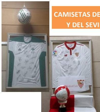
CAMISETAS DEL BETIS Y DEL SEVILLA